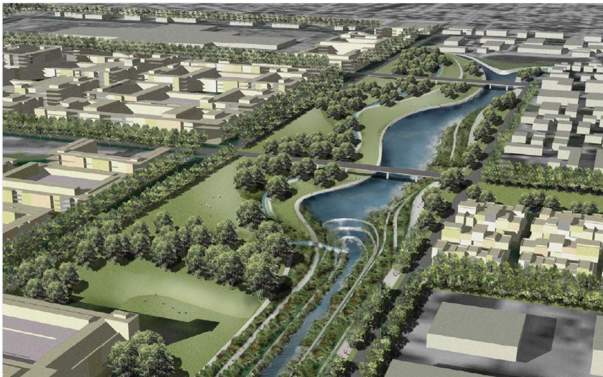
Un parque frente al Río propuesto en el emplazamiento con potencial en Canoga Park provee gran parte del espacio abierto tan necesitado en esa comunidad y en la escuela secundaria, también proveyendo hábitat en las terrazas del canal.

Cinco emplazamientos con potencial fueron seleccionados para un desarrollo más detallado de los conceptos de revitalización, incluyendo análisis económico: