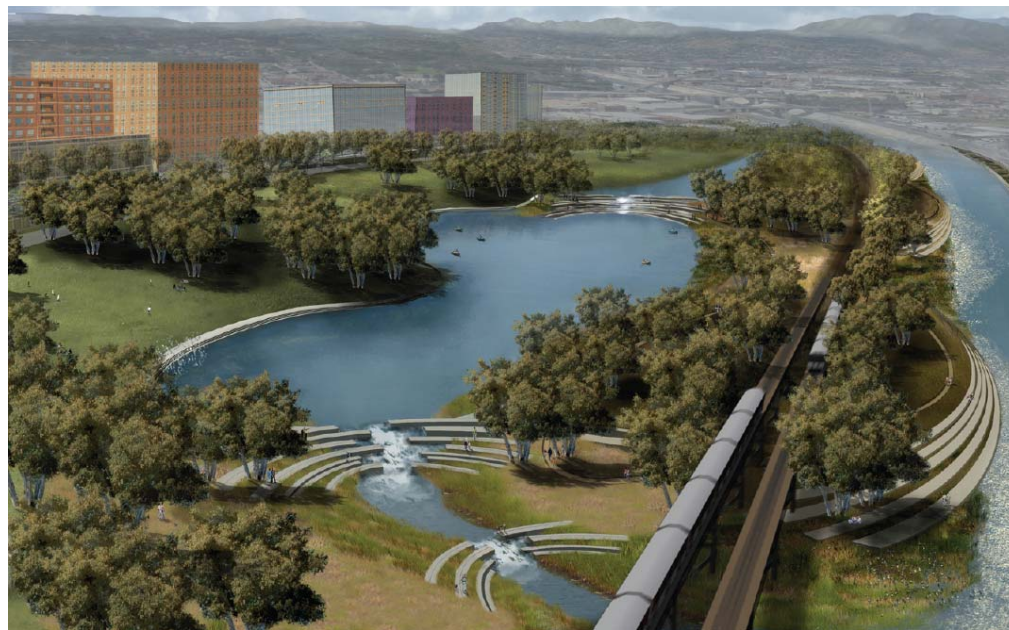
Un canal secundario propuesto en el emplazamiento con potencial en Chinatown-Cornfields proveerá una orilla del Río accesible y activa.

A medida que este sistema se vaya desarrollando, se pueden agregar elementos claves para enfatizar la identidad del Río, tales como portales, puentes, paseos, plazas, y otros puntos importantes. Utilizando esfuerzos pasados, las obras de arte público pueden ser partes importantes de este sistema. Dentro de cada vecindario los espacios libres no utilizados, así como los espacios públicos existentes tales como patios escolares pueden ser remodelados y formar parte de la red verde y del paisaje cultural mejorado.