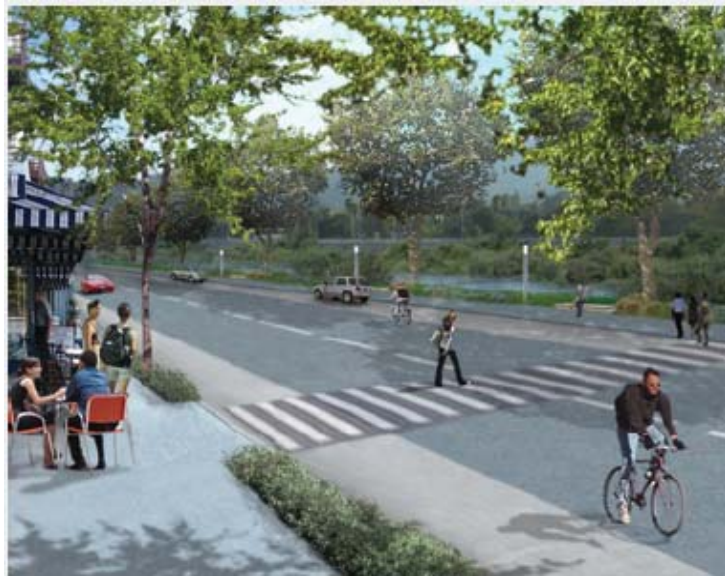
La tipología propuesta para las calles propone activar las calles adyacentes al Río con un borde para el comercio incluyendo cafés en las veredas a través del