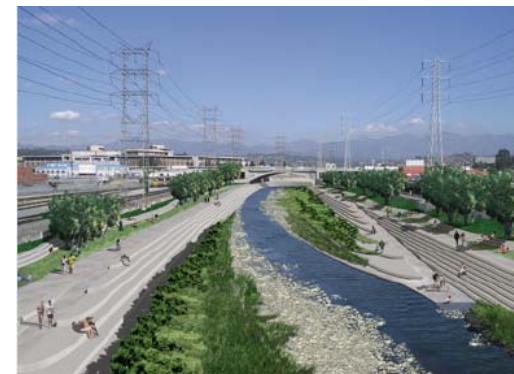
Mejoras a largo plazo modifican el canal y restauran el hábitat y proveen acceso en terrazas a la orilla del Río.

A corto plazo, las paredes del canal pueden ser modificadas para proveer un paisaje verde con terrazas con hábitat para la fauna salvaje, tratamiento de la calidad del agua, y mejorar así la satisfacción pública. Un sistema de caminos y pasos pueden proveer acceso público seguro. Para poder alcanzar las metas a largo plazo sería necesario mejorar la capacidad de volumen del canal y reducir la velocidad del caudal del agua. Esto puede obtenerse con una combinación de cosas tales como guardar parte del caudal fuera del canal, alcantarillas subterráneas y a largo plazo compra de terrenos para ensanchar el canal del Río.