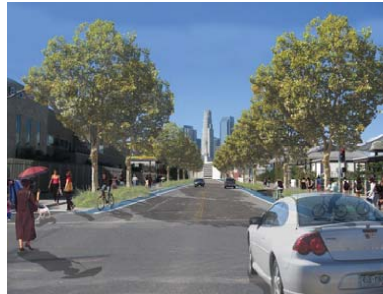
Las calles verdes propuestas a través del corredor del Río mejoran la conectividad no motorizada del Río.