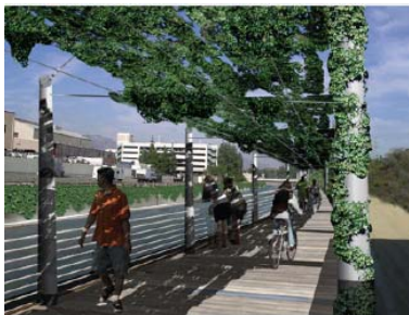
Un camino Verde del Río provee oportunidades para la recreación a lo largo de una porción limitada del Río.

Una de las estrategias críticas para lograr las metas del Plan es la implementación temprana de ejemplos que puedan usarse como muestras de las posibilidades de desarrollo en otros lugares. Para demostrar las posibilidades de la revitalización del Río, 20 emplazamientos con potencial se identificaron a lo largo del corredor del Río para ilustrar lo que sería posible a través de la implementación de varios escenarios de mejoras. Los emplazamientos con potencial representan enfoques para enfrentar condiciones que se repiten a lo largo del Río; por ejemplo construcción del corredor del Río por las vías ferroviarias, derecho de paso (ROW) limitado a través de zonas residenciales y zonas de desarrollo industrial.