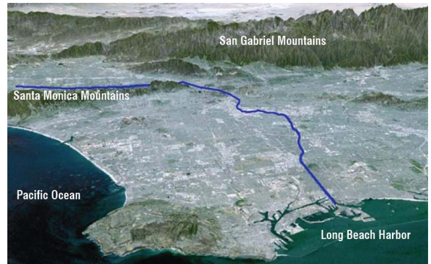
El largo del Río de Los Angeles (Cuerpo de Ingenieros del Ejército de los Estados Unidos. 1991)

El Río de los Angeles corre aproximadamente 51 millas desde su origen en la región del Valle de San Fernando de la Ciudad de Los Angeles hasta el puerto de Long Beach y el Océano Pacífico. El Río corre este/sureste a través de Los Angeles en su sector norte atravesando las ciudades de Burbank y Glendale y luego se orienta hacia al sur atravesando las ciudades de Vernon, Commerce, Maywood, Bell, Bell Gardens, South Gate, Lynwood, Compton, Paramount, Carson, and Long Beach, respectivamente. Las primeras 32 millas del Río que comprenden el área del proyecto del LARRMP atraviesa la Ciudad de Los Angeles atravesando 10 Consejos de la Ciudad (3,12,6,2,5,4,13,1,9,y 14 respectivamente), aproximadamente 20 Consejos Vecinales y 12 Areas de Planeamiento Comunitario de la siguiente manera (en orden geográfico de norte/noroeste a sur/sureste): 1) Canoga Park-Winnetka-Woodland Hills-West Hills; 2) Reseda; 3) Encino-Tarzana; 4) Van Nuys-North Sherman Oaks; 5) Sherman Oaks-Studio City-Toluca Lake-Cahuenga Pass; 6) North Hollywood-Valley Village; 7) Hollywood; 8) North East Los Angeles; 9) Silver Lake Echo Park; 10) Central City North; 11) Central City; y 12) Boyle Heights.